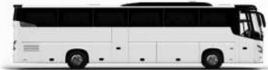
พิกัดรถโดยสาร 1 คัน

ค่าที่พักตามที่ระบุในรายการหรือเทียบเท่าระดับเดียวกัน (พักห้องละ 2 ท่าน) หากประเภทห้องพักท่านริเวลาเต็ม อาทิ เช่น ริเคลงห้องพักเป็น TWIN BED หรือ DOUBLE BED ทางบริษัทขอสงวนสิทธิ์ในการปรับประเภทห้องพัก เป็นตามที่โรงแรมมีอยู่ โดยไม่ดัดแปลงแจ้งให้ทราบล่วงหน้า