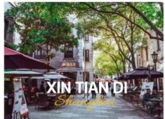
XIN TIAN DI Shanghai

ย่านใหม่ใจกลางเมืองเซี่ยงไฮ้ อีก 1 ย่านช้อปปิ้งและร้านอาหาร ร้านอาหาร ที่มีเอกลักษณ์ จากสถาปัตยกรรมที่ใช้อิฐบล็อกแบบสถาปัตยกรรมซีกเขมิน ซึ่งเป็นการผสมผสานกันระหว่างสถาปัตยกรรมจีนกับตะวันตกเข้าด้วยกัน ท่านจะพบกับทางเดินหิน กำแพงหิน ประติมากรรม ที่มีเอกลักษณ์ โดย 2 ทางของถนนมีต้นไม้เปิดตลอดทาง ยิ่งทำให้ย่านนี้มีเสน่ห์เพิ่มเป็นเท่าตัว