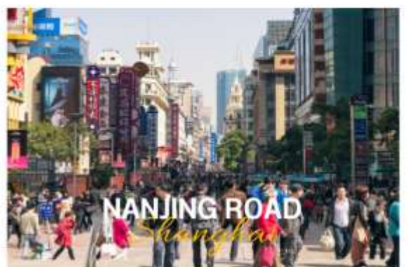
NANJING ROAD Shanghai

ถนนหนานจิง หรือที่รู้จักกันอีกชื่อว่า นานกิง ย่านช้อปปิ้งที่เก่าแก่และมีชื่อเสียงที่สุดในเซี่ยงไฮ้เลยในตอนเย็นจะเป็นช่วงที่ร้านค้าและบาร์ต่างๆกำลังคึกคักมีนักท่องเที่ยวเต็มไปดด้วยแสงสีเสียงเหมาะกับการเดินเล่นหรือนั่งรถรางชมบรรยากาศรอบๆฝั่งตะวันตกจะมีห้างสรรพสินค้าใหญ่ๆสลับกับร้านแบบจีนดั้งเดิมอยู่ตลอดสองข้างทาง