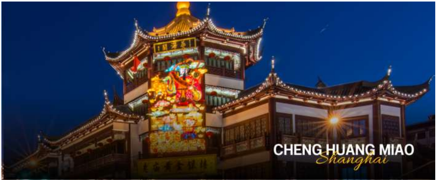
CHENG HUANG MIAO Shanghai