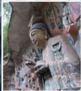
พระพุทธรูปหิน แกะสลักต้าจู่