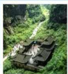
หลุมฟ้า สะพานสวรรค์

พระพุทธรูปแกะสลักหิน / หมู่บ้านโบราณฉือชี่ฮั่ว / มหาศาลาประชาคม / อุทยานหลุมฟ้าสะพานสวรรค์ / ระเบียบกระจก / อุทยานเขานางฟ้า / ถนนต้นจ้อคือ พิพิธภัณฑ์ศิลปะธงช้าง / ตึกหุยซิง (ตึก 22 ชั้น) / ถนนคนเดินเจียฟ่างเป่ย์ / หงหยาดัง / ศูนย์หมีแพนด้า / ที่ทำการไปรษณีย์หมีแพนด้า / ถนนโบราณจินหลี่