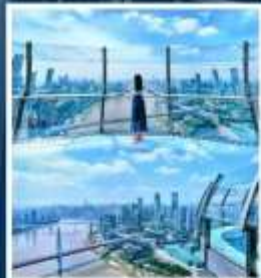
RAFFLES CITY CHONGQING