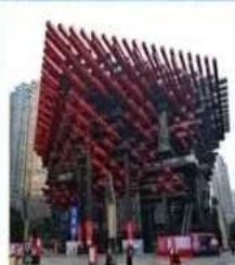
ตึกตะเกียบ