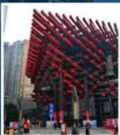
พิพิธภัณฑ์ศิลปะ ฉงชิ่ง