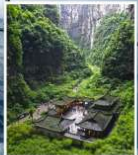
อุทยานหลุมฟ้า สะพานสวรรค์