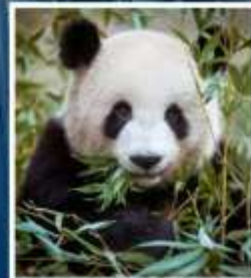
ศูนย์อนุรักษ์หมี แพนด้า