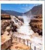
น้ำตกหูโซ่ว