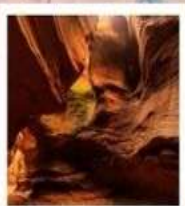
แกรนด์แคนยอนยูดาโกว