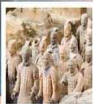
พิพิธภัณฑ์กองทัพใต้ดิน

หมู่บ้านถ้ำอ๋อเป๋อ / อุทยานอวิ้นชีวซาน / ถ้ำน้ำแข็งอวิ้นชีวซาน / น้ำตกหูโซ่ว / ที่ทำการประสานเหมา / แกรนด์แคนยอนยูดาโกว ถนนคนเดินวัฒนธรรมต้าถิง / กำแพงเมืองโบราณซีอัน / เจดีย์ห่านป่าใหญ่ / พิพิธภัณฑ์กองทัพใต้ดินทหารม้าจีนซี