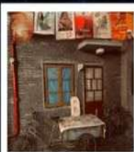
คาเฟ่ย้อนยุคเหอผิง