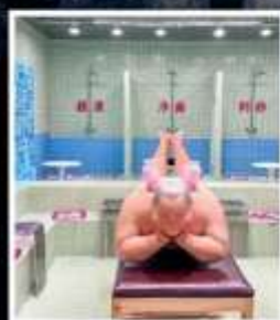
คาเฟ่ย้อนยุคเหอผิง