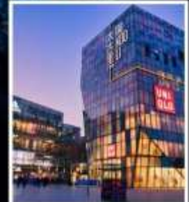
ย่านซานหลี่ถุน