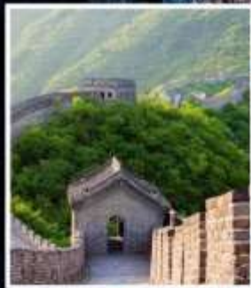
กำแพงเมืองจีน มู่เถียนยวี่