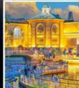
ห้าง SOLANA CENTER