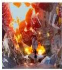
SPACE & TIME CUBE