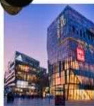
ย่านซานหลี่ถุน