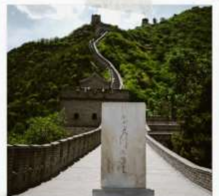
กำแพงเมืองจีน ด่านจวิหยงกวน