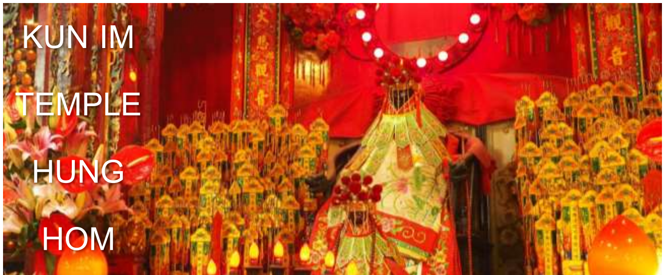
KUN IM TEMPLE HUNG HOM

นำท่านไปไหว้ เจ้าแม่กวนอิมสองส่า (Kun Im Temple Hung Hom) เป็นวัดเจ้าแม่กวนอิมที่มีชื่อเสียงแห่งหนึ่งในฮ่องกง ขอพรเจ้าแม่กวนอิมพระโพธิสัตว์แห่งความเมตตา ช่วยคุ้มครองและปกป้องรักษาวัดเจ้าแม่กวนอิมที่ Hung Hom หรือ 'Hung Hom Kwun Yum Temple' เป็นวัดเก่าแก่ของฮ่องกงสร้างตั้งแต่ปี ค.ศ. 1873 ถึงแม้จะเป็นวัดขนาดเล็กที่ไม่ได้สวยงามมากมาย แต่เป็นวัดเจ้าแม่กวนอิมที่ชาวฮ่องกงนับถือมาก แทบทุกวันจะมีคนมาบูชาขอพรกันแน่นวัด ถ้าใครที่ชอบเสียงเชี่ยมซีเขาบอกว่าที่นี่แมนมากที่พิเศษกว่านั้น นอกจากสักการะขอพรแล้วยังมีพิธีขอขงอ้งเปาจากเจ้าแม่กวนอิมอีกด้วย อีสระท่านขอพรตามอัธยาศัย