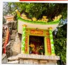
ศาลเจ้าติงชาว