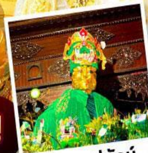
ซอพรแม่ยักย์