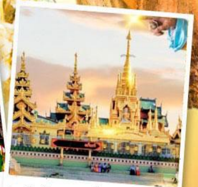
เจดีย์กลางน้ำ (สิริเยม)