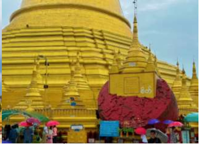
นำคณะเดินทางสู่ เมืองไจ้กั๊ย (Kyaikhtyo) ใช้เวลาเดินทางประมาณ 2-3 ชั่วโมง