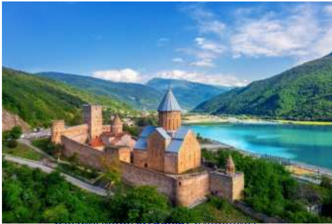
คำ ที่ปัก