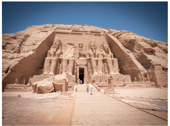
คำนวณของชาวอียิปต์โบราณ