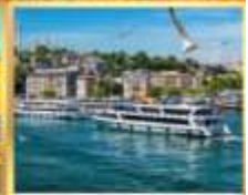
เรือเฟอร์รี่

เที่ยวครบเส้นทางยอดนิยม มินเข้าถึงเย็น เช้าชมสุเหร่ายักษ์คามลิก้า และล่องเรือเฟอร์รี่ ชมเทศกาลทิวลิปแห่งนครอิสตันบูล