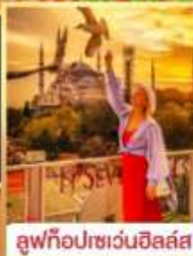
ลูปทือปเซเวนฮิลส์