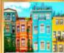
บ้านหลากสี คิลเลอร์ฟู