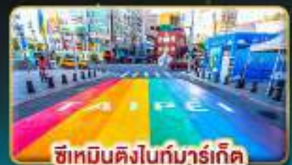
ซีเหมินติงไนท์มาร์เก็ต