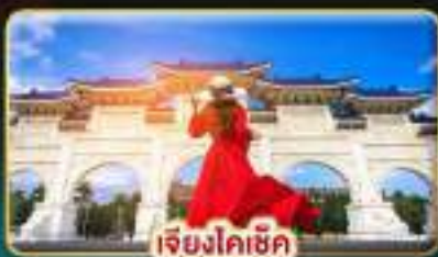
เจียงโคเช็ก