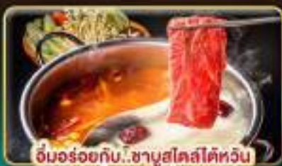
จิ้มอร่อยกับ..ชาบูสโกลด์ไต้หวัน เมนูที่ไม่ใช่แค่อร่อยดี แต่ยังสุขภาพดี