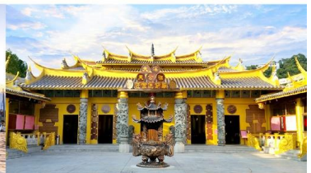
วัดเถาหยวนต้าซิ่งฟู่ซ่งจง

*ทางบริษัทฯ ขอสงวนสิทธิ์ในการสลับโปรแกรมทัวร์ตามความเหมาะสมขึ้นอยู่กับสถานการณ์หน้างาน โดยคำนึงถึงผลประโยชน์ของลูกค้าเป็นสำคัญ