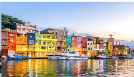
ทำเรือประมงเจิ้งปิ่น