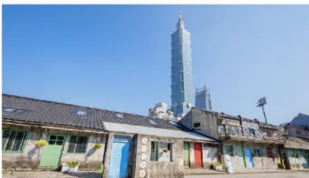
หมู่บ้านชื้อชื้อหนาน