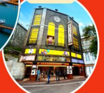
ร้าน POP MART ใหญ่ที่สุดในไต้หวัน