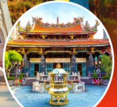
วัดหลงชาน