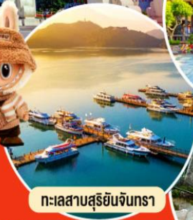
ทะเลสาบสุริยอินจันตรา