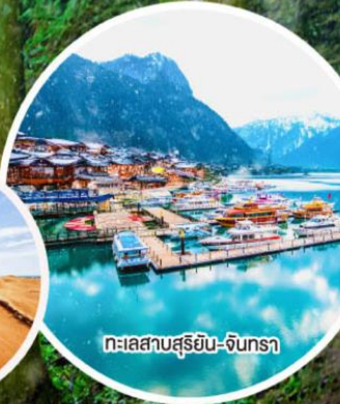
ทะเลสาบสุริยัน-จันทรา