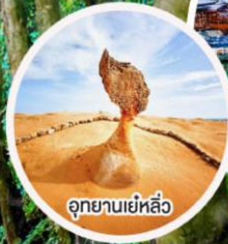
อุทยานเย่หลิว