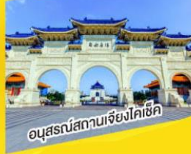
อนุสรณ์สถานเจียงไคเช็ค