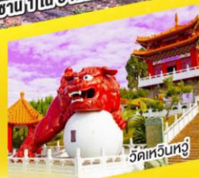
วัดเหวินหวู่