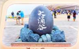
ดูบเขาไฟฟ้ห้าอวาคุดานิ

สายการบิน AirAsia X (XJ) น้ำหนักกระเป๋า 20 KG