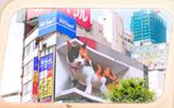
ช้อปปิงย่านชินจูกุ