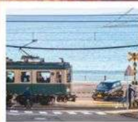
รถไฟเอโนะเด็ตสึ

วัดนาริตะ / ฮิโออน พลาซ่า / ฟุจियามะ ทาวเวอร์ / โอชิโนะ ฮักไก สวนโอเอซึ ปาร์ค / นั่งรถไฟเอโนะเด็ตสึ / วัดฮาเซเดระ / วัดโกโตคุอิน ซ็องปิ้งซันจูกุ / โตเกียว ดิสนีย์แลนด์ (รวมค่าบัตรเข้า) พระพุทธรูปอุซึคุโดบุทสึ / อามิ พรี่เมี่ยม เอาก์เล็ก / วัดเปาถง เซนาโต้สแควร์ / วัดอาม่า / เดอะเวเนเซียน / เดอะ คอนดอนเนอร์