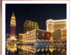
เดอะ เวเนเซียน มาเก๊า