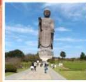
พระพุทธรูปอุชิคุโดบุทสึ