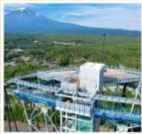
ฟูจิยามะ ทาวเวอร์