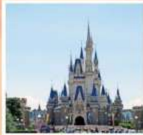
โตเกียว ดิสนีย์แลนด์