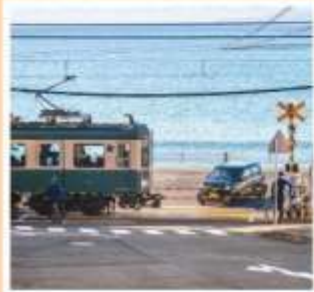
รถไฟเอโบะเด็น