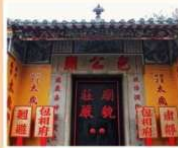
วัดเปากง