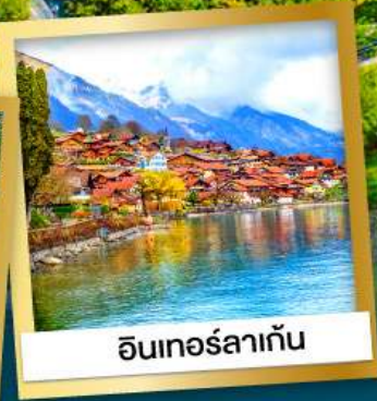
อินเทอร์ลาเก้น