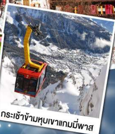
กระเช้าข้ามหุบเขาแกมมีพาส

11-17 มี.ค. 68 02-08 เม.ย. 68 29 เม.ย.-05 พ.ค. 68