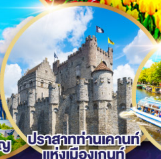
ปราสาทท่านเคานท์แห่งเมืองเกนท์