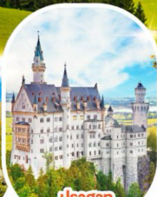
ปราสาท นอยชวานชไตน์