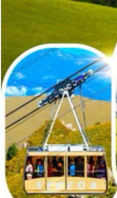
กระเช้าซีเคด้า