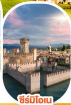
ซีร์มิโอเน