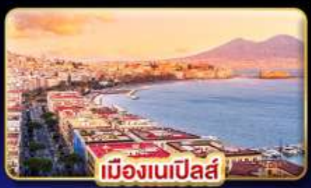
เมืองเนเปิลส์