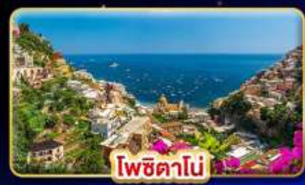
โพซิทานิ