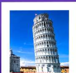
หอเอนเมืองปิซ่า