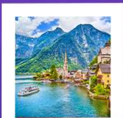
หมู่บ้านอัลลส์ดัทท์