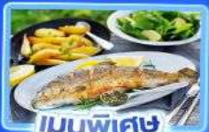
เมนูพิเศษ ปลาเกรดอย่าง

อัลสส์ตัทท์ เวียนนา อินส์บรุค ปราสาทนอยชวานสไตน์ ลูเซิร์น ริก