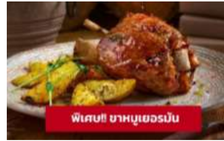
พิเศษ! ขาหมูเยอรมัน

นำท่านเที่ยวชมเมืองฟุสเซน (Fussen) ขึ้นชื่อเรื่องความสวยงามของตัวตึก รามบ้านช่องเพราะทั้งเมืองจะมีหลากสีสันทันเหมือนกับลูกกวาดสีสวยๆ ทั้ง เมืองจนได้รับสมญานามว่า City of candy นำท่านเดินทางสู่เมืองเคมพ์เทิน (Kempten) (ระยะทาง 46 กม./ 1 ชั่วโมง) เป็นชุมชนเมืองที่เก่าแก่ที่สุดใน เยอรมนี ให้ท่านถ่ายรูปบริเวณด้านนอก มหาวิหารเซนต์ลอว์เรนซ์ แอชวิลล์ (Basilica of Saint Lawrence) สร้างเสร็จในปี 1909 และเป็นหนึ่งในสมบัติ ทางสถาปัตยกรรมและจุดยึดทางจิตวิญญาณของแอชวิลล์