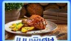
เมนูพิเศษ จากมูเยอร์มัน