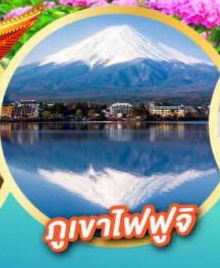
ภูเขาไฟฟูจิ