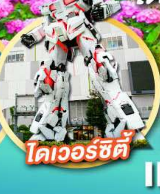
โตเวอร์ซิตี