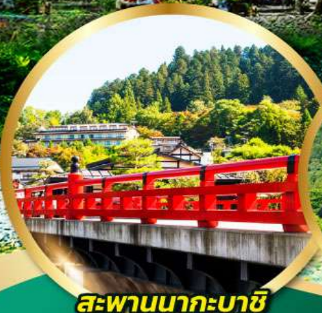
สะพานนาคะบาชิ