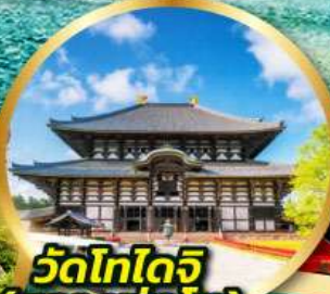
วัดโทไดจิ (หลวงพ่อด)