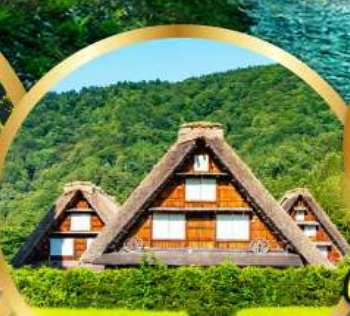
หมู่บ้านมรดกโลก ชิราคาวาโกะ