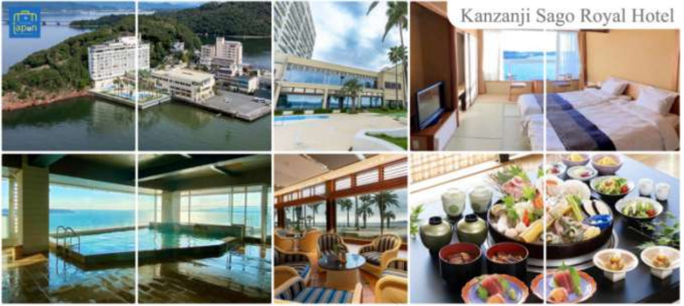
Kanzanji Sago Royal Hotel

วันที่สี่ เมืองฮามามัตสึ – ล่องเรือสำราญทะเลสาบฮามานะโกะ – จังหวัดชิซุโอกะ – นินงะไดระยูเมะเทอร์เรซ – น้ำตกชิราอิโตะ – เมืองยามานาชิ – หมู่บ้านโอชิโนะฮัตไต – ออนเซ็น + ชาบูยักษ์