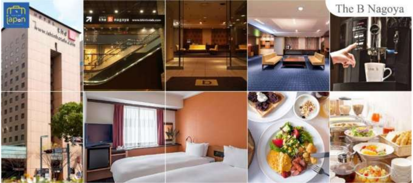
The B Nagoya

ที่พัก THE B NAGOYA หรือเทียบเท่าระดับเดียวกัน