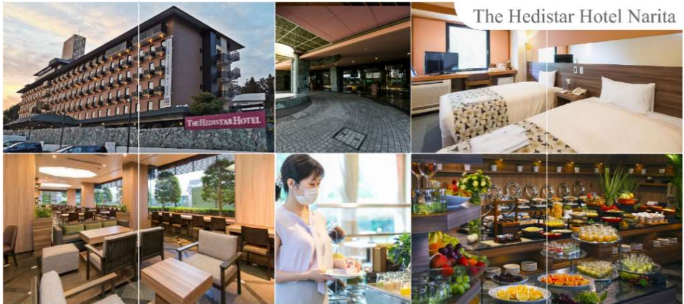
The Hedistar Hotel Narita

THE HEDISTAR HOTEL, NARITAหรือเทียบเท่าระดับเดียวกัน