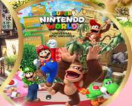
อิสระเลือกซื้อ UNIVERSAL STUDIOS JAPAN