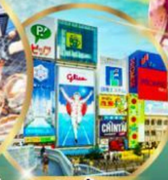
ช้อปปิ้ง ย่านชินโซบาชิ