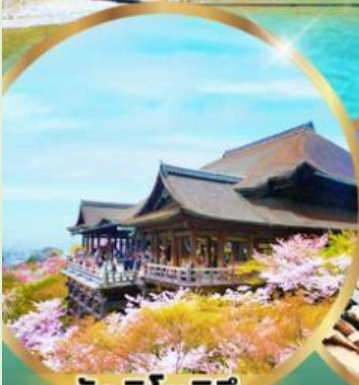
วัดคิโยมิสึ