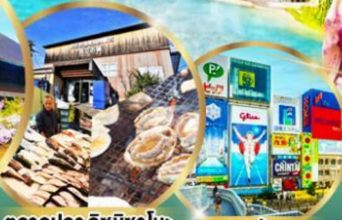
ตลาดปลา อิชุมิซาโนะ