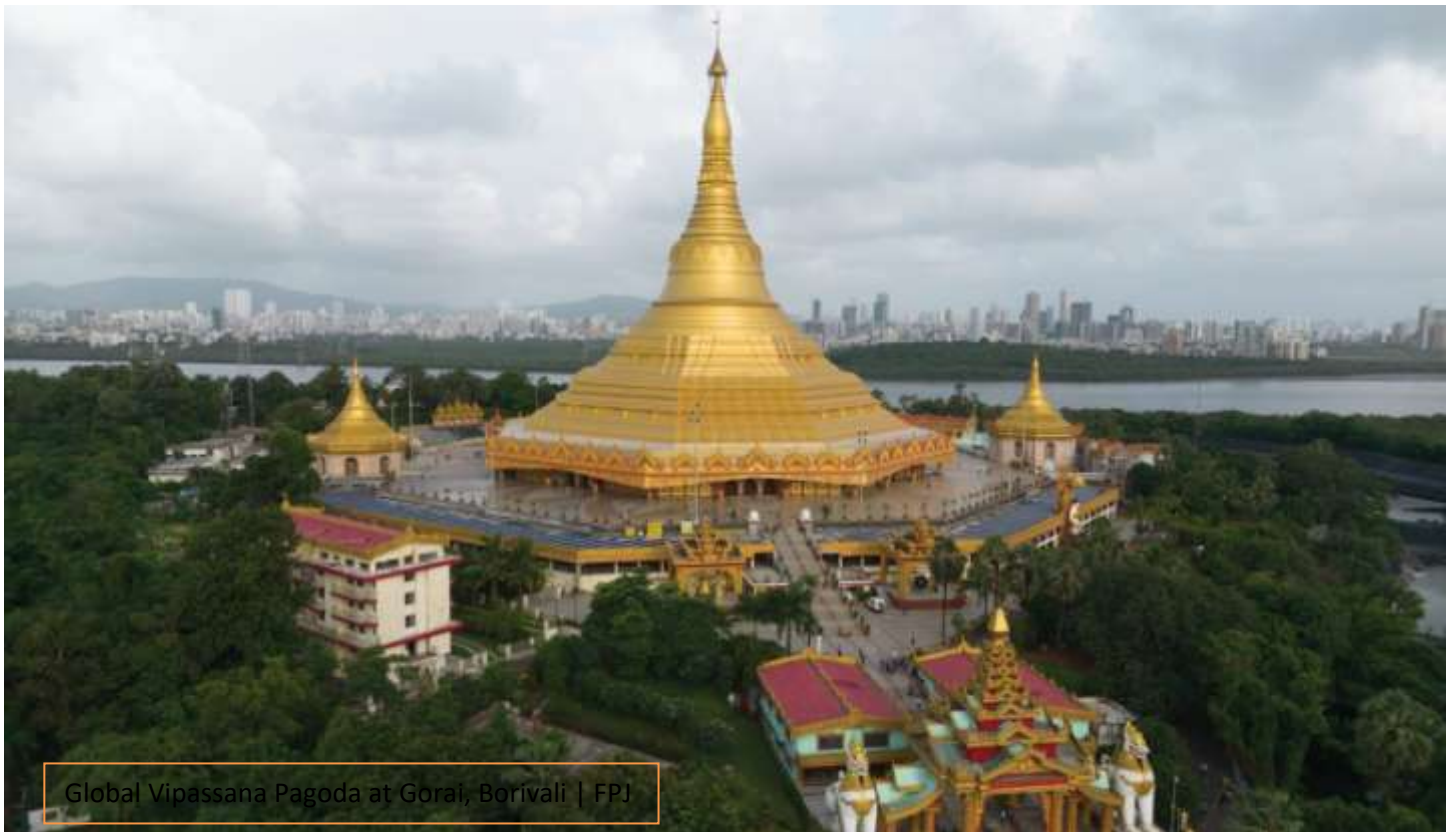
Global Vipassana Pagoda at Gorai, Borivali

(กรุณางดใส่กางเกงขาสั้น) นำท่านชมวิหารท่านโกเอ็นก้าสร้างขึ้นเมื่อปีพ.ศ.2517 ตามพลังศรัทธาชาวฮินดูผู้เลื่อมใสในพระพุทธศาสนาสถาบันวิปัสสนานานาชาติGlobal Vipassana Pagoda "ธรรมศิริ" ที่เมืองอิกัตปุรีใกล้ๆกับเมืองบอมเบย์เจดีย์นี้เปิดอย่างเป็นทางการโดยประติภาปาฐิตีประธานาธิบดีแห่งประเทศอินเดียในขณะนั้นเมื่อ 8 กุมภาพันธ์ 2009 ที่ดินที่