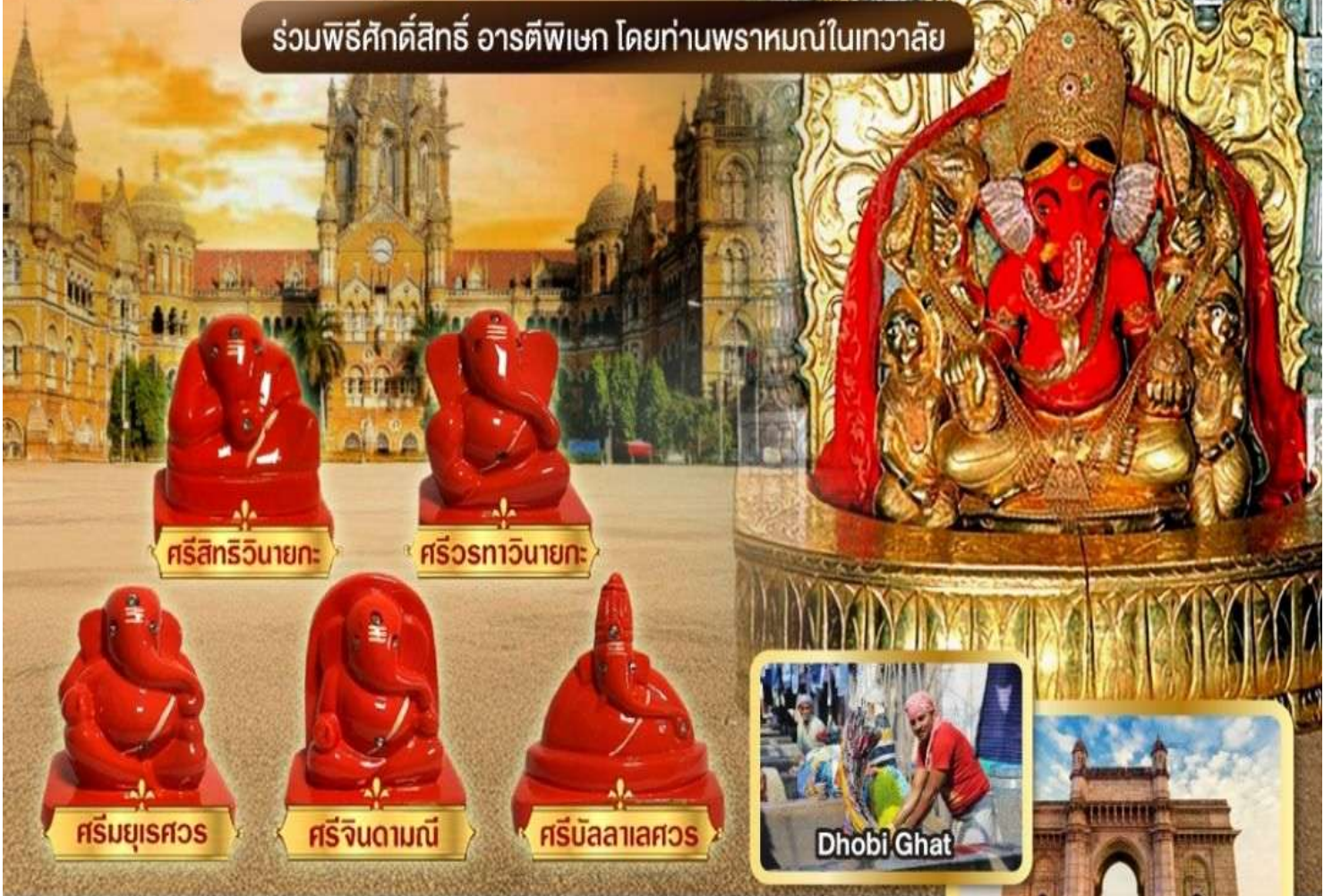
ศรีสิทธวิฆนายะ

ร่วมพิธีศักดิ์สิทธิ์ อารตีพิเชก โดยท่านพราหมณ์ในเทวาลัย