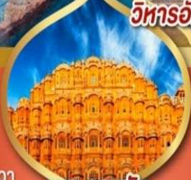
พระราชวังสายลม