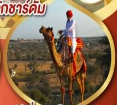
ฟรีขี่อูฐ เมืองมันทวา ราคาเริ่มต้น