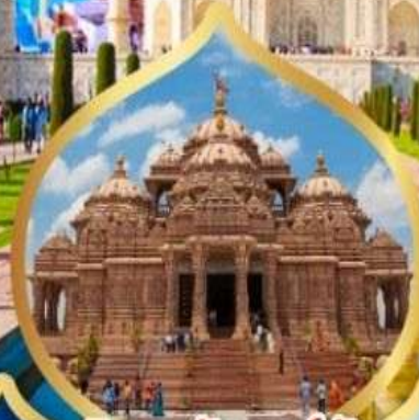
วิหารอัคราดีม