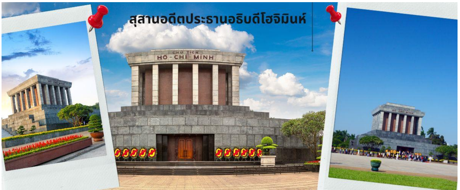
สุสานอดีตประธานาธิบดีโฮจิมินห์

จากนั้นนำท่านเข้าสู่ สุสานอดีตประธานาธิบดีโฮจิมินห์ (ชมด้านนอก) อยู่ที่ จัตุรัสบาติงห์ ใจกลางกรุงฮานอยเป็นสถานที่เก็บศพภายในบรรจุศพอาน้ำยาของโฮจิมินห์นอนสงบอยู่ในโลง