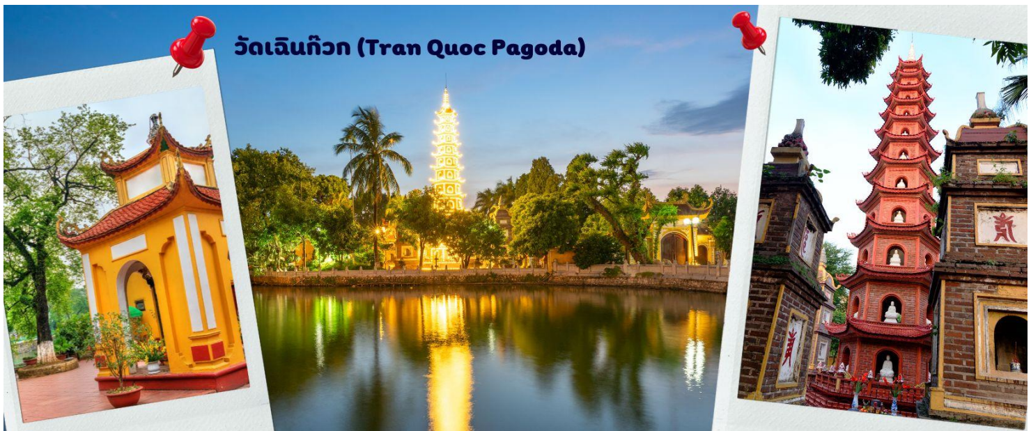
วัดเจินก๊วก (Tran Quoc Pagoda)

จากนั้นนำท่านไป วัดเจินก๊วก (Tran Quoc Pagoda) เป็นวัดที่อยู่ใจกลางเมืองของเวียดนาม ใกล้ชิดกับทะเลสาบตะวันตกของเมืองฮานอย สร้างด้วยสถาปัตยกรรมจีนโบราณ มีความร่มรื่น และบรรยากาศดี จึงเป็นที่นิยมของนักท่องเที่ยวทั้งที่ชื่นชมความงามและมีศรัทธาในพระพุทธศาสนา จากภาพมุมสูงของสถานที่ตั้ง ที่นี้เหมือนตั้งอยู่บนเกาะที่ยื่นลงไปทะเลสาบ แต่มีเส้นทางคมนาคมเข้าถึงที่ สิ่งปลูกสร้างมีการวางผังเป็นอย่างดี ใช้สีสันทึบกลมกลืนในโทนสีเหลือง น้ำตาล ตัดกับสีเขียวของต้นไม้ใหญ่ที่โอบล้อมอยู่ในมุมถ่ายภาพจากอีกฝั่งหนึ่ง จะเห็นสิ่งปลูกสร้างสไตล์จีน และเจดีย์หลายชั้นโดดเด่น มีภาพที่สะท้อนลงสู่ผืนน้ำ เป็นภูมิทัศน์ที่งดงามทั้งยามกลางวันและยามค่ำคืนที่มีการ