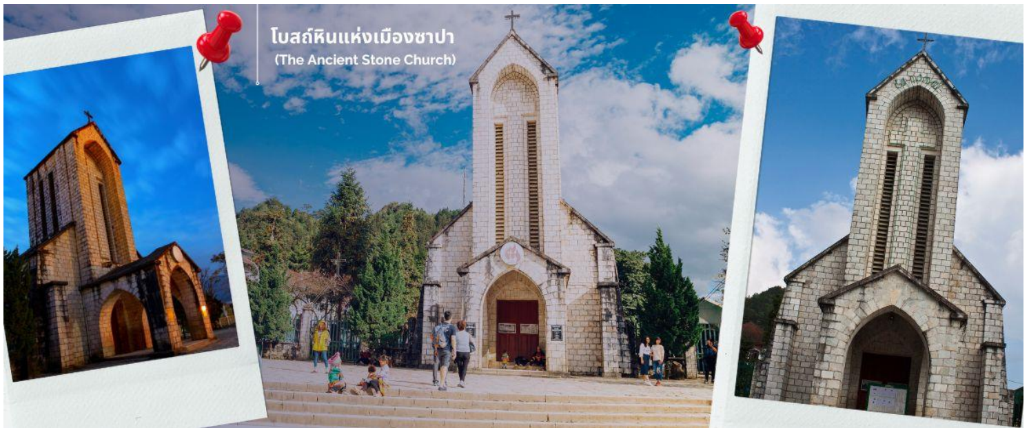
โบสถ์หินแห่งเมืองซาปา (The Ancient Stone Church)

จากนั้นพาทุกท่านชม โบสถ์หินแห่งเมืองซาปา (The Ancient Stone Church) อีกหนึ่งแลนด์มาร์กสำคัญของซาปาที่ต้องไปเช็คอิน เป็นโบสถ์หินที่สร้างขึ้นโดยชาวฝรั่งเศส เนื่องจากครั้งที่เป็นเมืองอาณานิคม มีชาวฝรั่งเศสมาอาศัยอยู่เมืองซาปาจำนวนมาก จึงเป็นโบสถ์สำคัญของเมืองนี้ที่ใช้ในการร่วมพิธีมิสซา ถึงแม้ว่าในตอนนี้อาณานิคมจะย้ายกลับไปแล้ว แต่โบสถ์แห่งนี้ก็ได้รับการอนุรักษ์เอาไว้เป็นอย่างดีและชาวซาปาที่เป็นคาทอลิกก็ยังคงใช้งานอยู่จนปัจจุบัน นำท่านช้อปปิ้งที่ ตลาดไนต์เมืองซาปา มีสินค้าให้ท่านเลือกช้อปปิ้งมากมาย ไม่ว่าจะเป็นสินค้าพื้นเมือง ของฝาก ขนม กระเป๋า รองเท้า ท่านสามารถช้อปปิ้งได้อย่างจุใจ