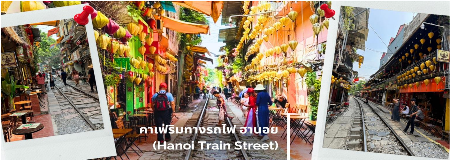
คาเฟ่ริมทางรถไฟ ฮานอย (Hanoi Train Street)

ค่า รับประทานอาหารค่ำ ณ ภัตตาคาร (10) บุฟเฟ่ต์อาหารนานาชาติ