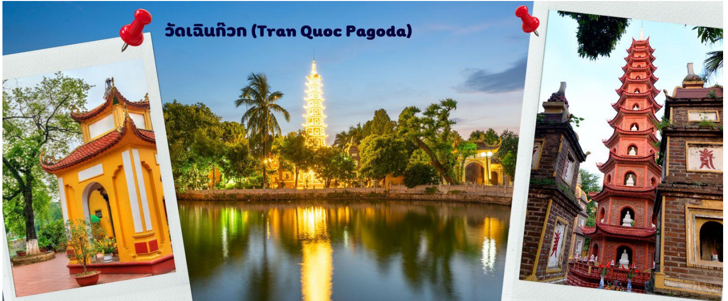
วัดเจ็นกิว (Tran Quoc Pagoda)

มีศรัทธาในพระพุทธศาสนา จากภาพมุมสูงของสถานที่ตั้ง ที่นี้เหมือนตั้งอยู่บนเกาะที่ยื่นลงไปทะเลสาบ แต่มีเส้นทางคมนาคมเข้าถึงที่ สิ่งปลูกสร้างมีการวางผังเป็นอย่างดี ใช้สีสันทึกลับกมลกลืนในโทนสีเหลือง น้ำตาล ตัดกับสีเขียวของต้นไม้ใหญ่ที่โอบล้อมอยู่ ในมุมถ่ายภาพจากอีกฝั่งหนึ่ง จะเห็นสิ่งปลูกสร้างสไตล์จีน และเจดีย์หลายชั้นโดดเด่น มีภาพที่สะท้อนลงสู่ผืนน้ำ เป็นภูมิทัศน์ที่งดงามทั้งยามกลางวันและยามค่ำคืนที่มีการเปิดไฟส่องสว่าง