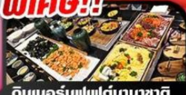
ดินเนอร์บุฟเฟต์นานาชาติ บนบานาฮิลล์ 1 มื้อ