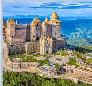
ปราสาทจันทร์