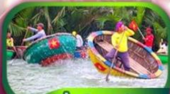
นั่งเรือกระด้าง