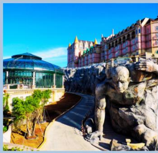
โซน Eclipse Square