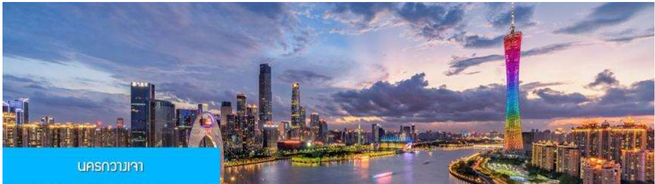
นครกวางเจา