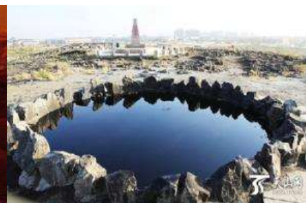
บ่อน้ำมึนสีดำ