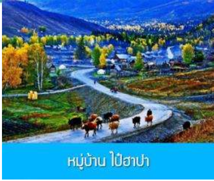
หมู่บ้าน ไปฮาปา