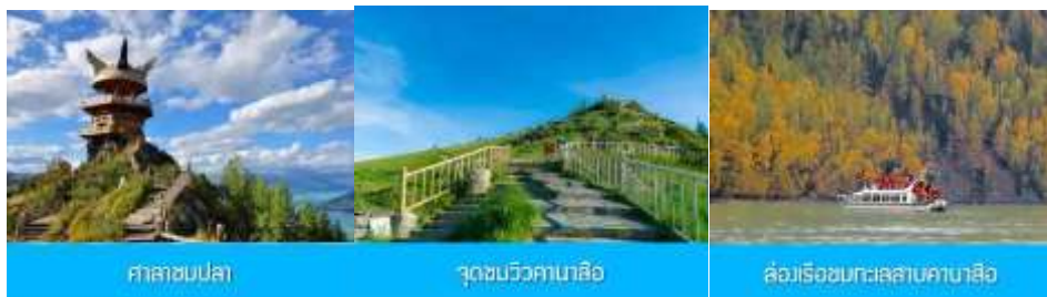
ศาลาชมปลา

รับประทานอาหารกลางวัน ณ ร้านอาหารในเขตอุทยานฯ (เมนูอาหารอัฟเกรด 80 หยวน/หัว) (มื้อที่ 8)