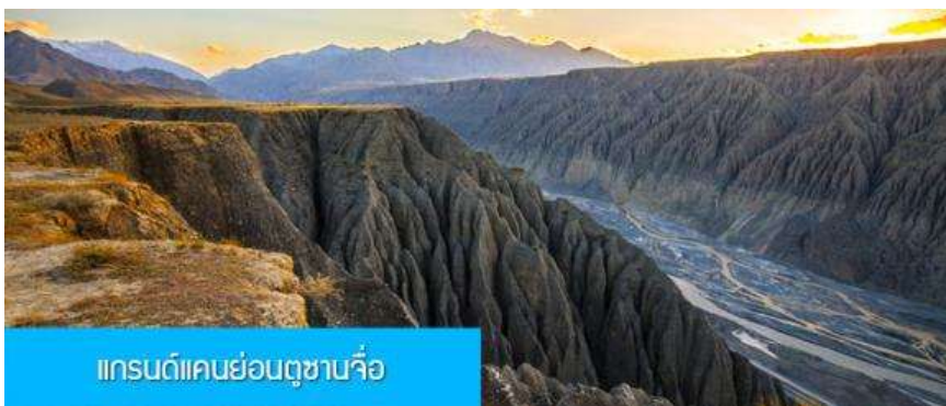
แกรนด์แคนยอนตูซซานจื่อ

พักที่ RUI JING HOTEL โรงแรมระดับ 4 ดาวท้องถิ่นหรือเทียบเท่าในเมืองขุยถุน