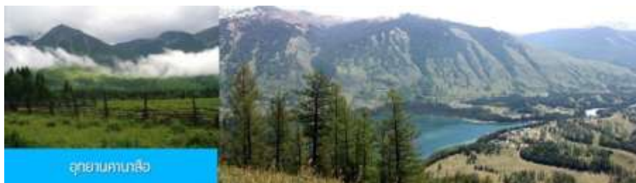
อุทยานคานาสือ

หลังอาหารเช้าท่านเดินเล่นเก็บภาพที่ระลึก ณ มุมสวย ๆ บริเวณหมู่บ้าน จากนั้นนำท่านเดินทางสู่ อุทยานคานาสือ 喀纳斯景区 ดินแดนที่สวยงามดูภาพเขียน สงบและมีอากาศที่บริสุทธิ์ปราศจากมลพิษ ระหว่างทางผ่านชมทัศนียภาพโดยรอบที่สวยงามเหนือคำบรรยาย แวะถ่ายรูป ณ ทุ่งหญ้าสีเขียวที่กว้างสุดขอบฟ้า จนควรแก่เวลานำท่านเดินทางเข้าสู่โรงแรมที่พัก