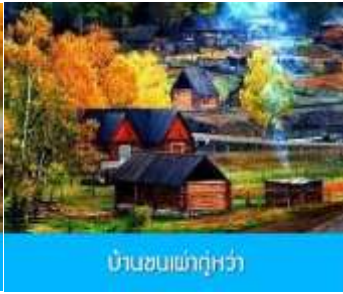
บ้านชนเผ่าถู่หว่า