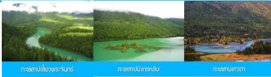
ทะเลสาบเลี้ยวพระจันทร์