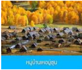
หมู่บ้านเหม่อซุน