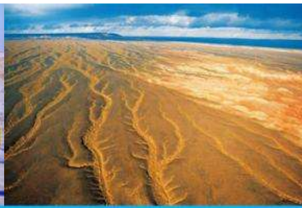
ทะเลทรายกุ้อปิงทงกุ้อเรอ