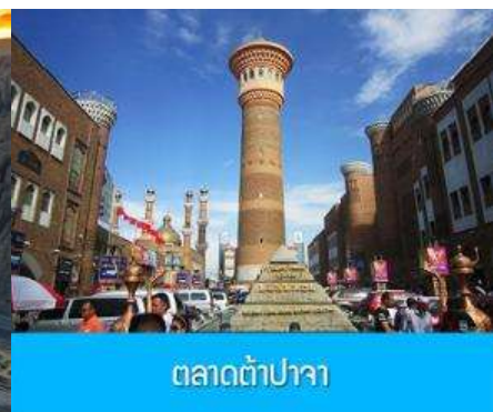
ตลาดต้าปาจา