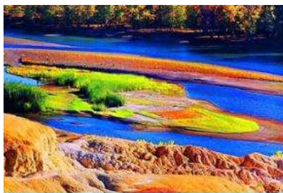
หาดธารน้ำห้าสี