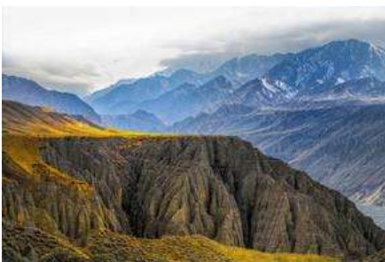
เมืองเคอลาหม่า

พักที่ SUTONG HOLIDAY HOTEL โรงแรมระดับ 4 ดาวหรือเทียบเท่าในเมืองปูเอ้อจิน