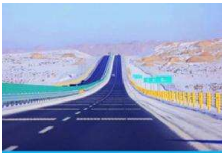
S21 DESERT HIGHWAY