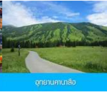
อุทยานคานาสือ