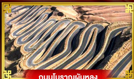
ถนนโบราณพันหลง

“คัชการ์” เที่ยวสุดขอบตะวันตกประเทศจีน เมืองเก่าแห่งยุคเส้นทางสายไหมโบราณ