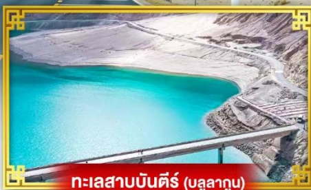
ทะเลสาบบันตีร์ (บลูลากูม)