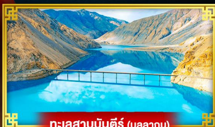
ทะเลสาบบันตีร์ (บลูลากูน)