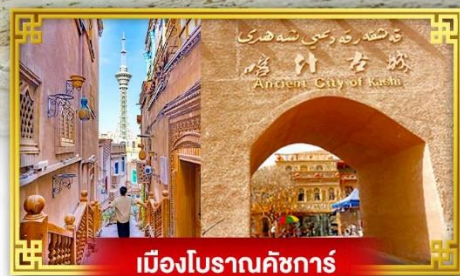
เมืองโบราณคัชการ์

เดินทางโดย : สายการบินโซนาเซาเทิร์นแอร์ไลน์