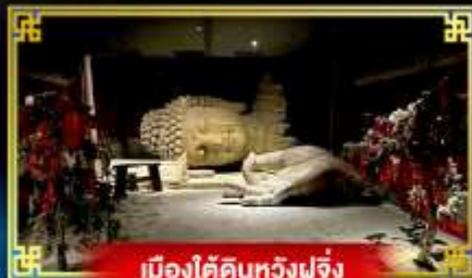
เมืองใต้ดินหวังฝูจิ่ง