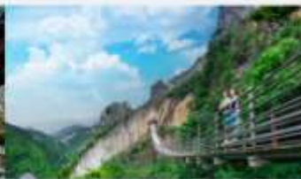
หุบเขารอยแยกอุ๋หลิงซาน