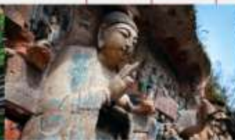
ผาคินแกะสลักต้าจู้ เขาเป่าติงซาน