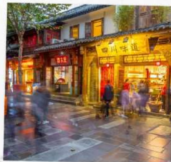
ถนนชอยกว้างแคบ