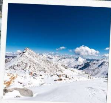
ภูเขาหิมะการ์เซีย ตำกู่ปิงชวน