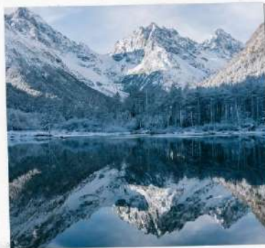
อุทยานปีเพิงโกว