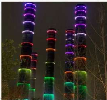
ชมแสงสีห้าง SKP