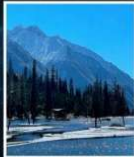
อุทยานชวงเฉียวโกว