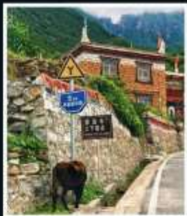
หมู่บ้านทิเบต