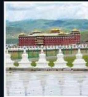
วัดต้าถง