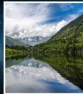
อุทยานมู่เก่อจิว