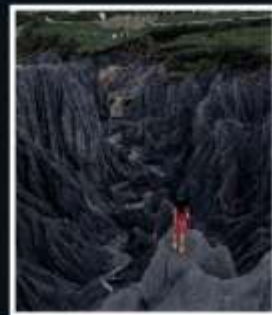
สวนหินปาเหมย์