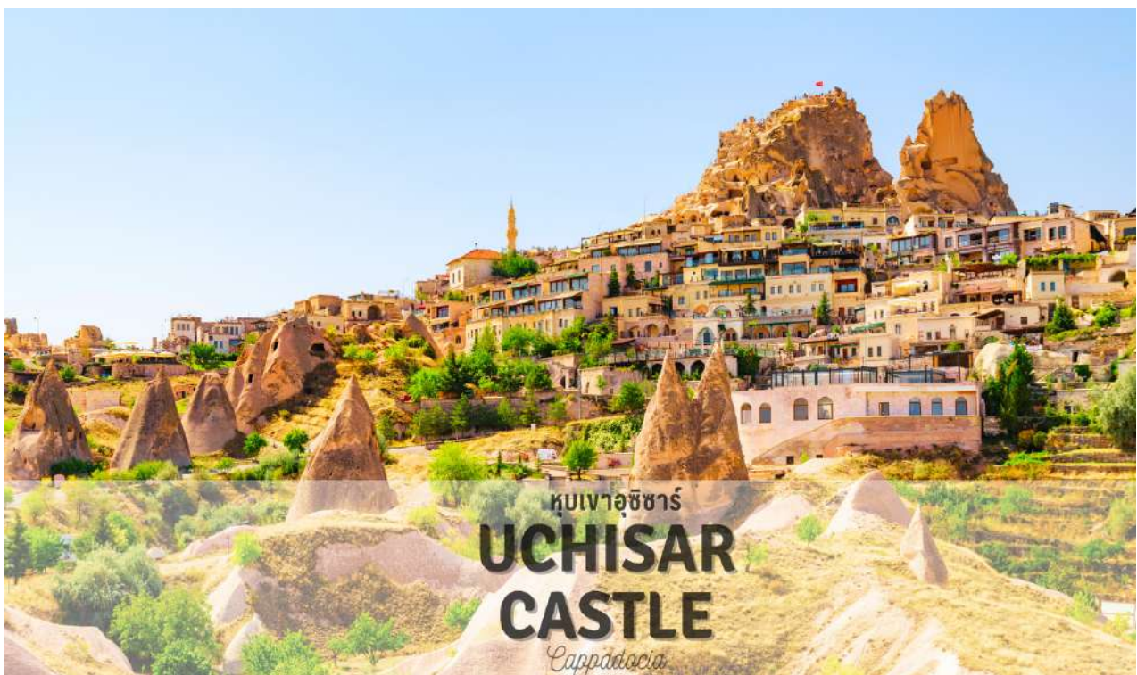
หุบเขาอุชิซาร์ UCHISAR CASTLE Cappadocia

แวะถ่ายรูป หุบเขาอุชิซาร์ (UCHISAR VALLEY) หุบเขาคัลายจอมปลวกขนาดใหญ่ ใช้เป็นที่อยู่อาศัย ซึ่งหุบเขาดังกล่าวมีรูพรุน มีรอยเจาะรอยขุด อันเกิดจากฝีมือมนุษย์ไปเกือบทั่วทั้งภูเขา เพื่อเอาไว้เป็นที่อยู่อาศัย