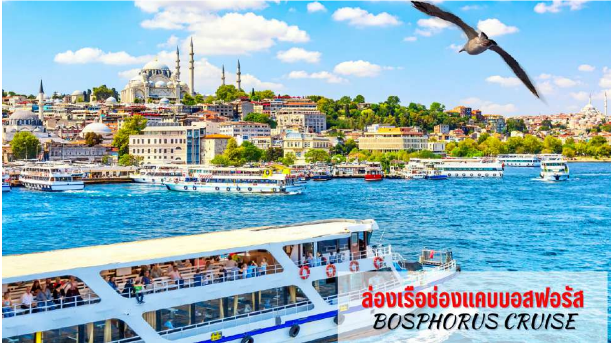
ล่องเรือช่องแคบบอสฟอรัส BOSPHORUS CRUISE

ที่สุดของยุโรปและเอเชียมาพบกันที่นี้ นอกจากความสวยงามแล้ว ช่องแคบบอสฟอรัสยังเป็นจุดยุทธศาสตร์ที่สำคัญยิ่งในการป้องกันประเทศตุรเคียอีกด้วย ขณะล่องเรือท่านจะได้เพลิดเพลินกับการชมทิวทัศน์ที่สวยงามทั้งสองข้างทางไม่ว่าจะเป็นพระราชวังโดลมาบาห์เซ่หรือบ้านเรือนสไตล์ยุโรปของบรรดาเศรษฐีตุรเคียและมีป้อมปืนตั้งเรียงราย