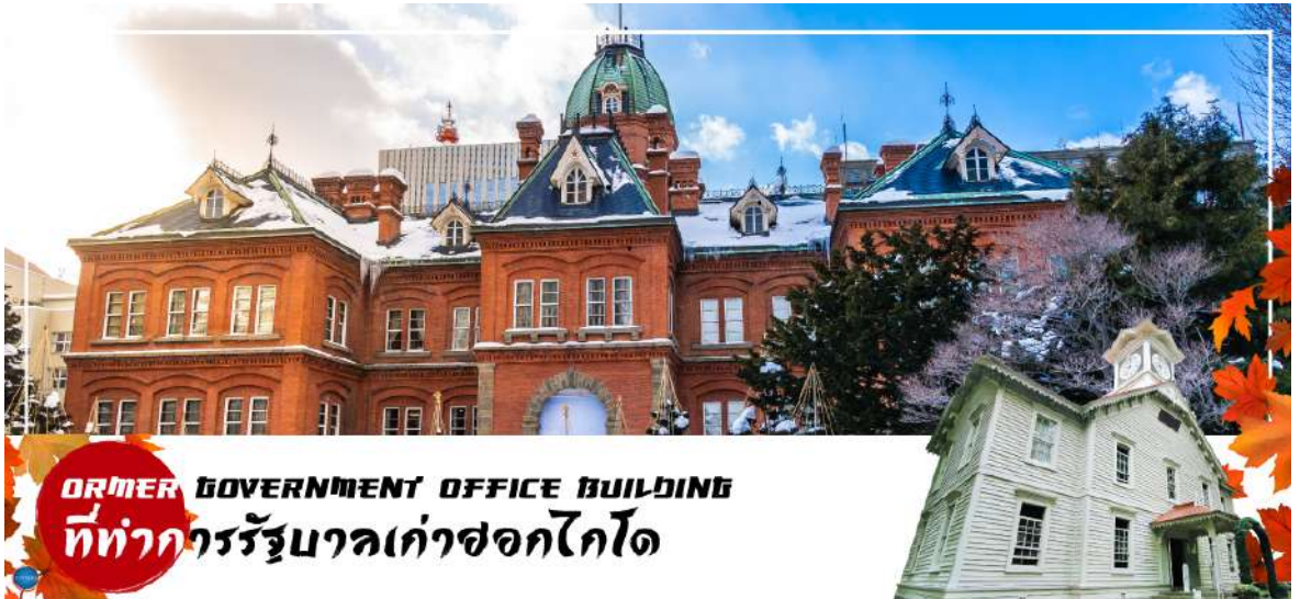
FORMER GOVERNMENT OFFICE BUILDING ที่ทำการรัฐบาลเก่าซอกไกโด

จากนั้น ผ่านชม หอนาฬิกาเมืองซัปโปโร (Sapporo Clock Tower หรือภาษาญี่ปุ่นเรียกว่า Sapporo Tokeidai ) เป็นหอนาฬิกาโบราณมีลักษณะเป็นอาคารไม้ที่มีหลังคาสีแดงและผนังสีขาว ถูกออกแบบและบริจาคให้โดยรัฐบาลสหรัฐอเมริกา ในปี ค.ศ. 1878 เป็นสัญลักษณ์ทางวัฒนธรรม และประวัติศาสตร์ของเมืองซัปโปโร สำหรับตัวนาฬิกาถูกติดตั้งในปี ค.ศ. 1881 จากบริษัท E. Howard & Co. เมือง Boston และในปี ค.ศ. 1970 หอนาฬิกาแห่งนี้ถูกกำหนดให้เป็นทรัพย์สินทางวัฒนธรรมที่สำคัญแห่งชาติ อีกด้วย