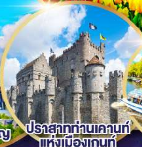
ปราสาทท่านเคานท์แห่งเมืองเกนท์