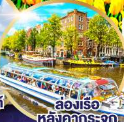
ล่องเรือหลังคึกกระจัก