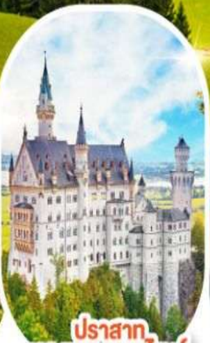
ปราสาท นอยชวานชไตน์