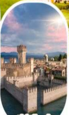
ซิร์มีโอเน่