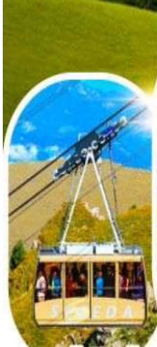
กระเช้าซิคเคต้า