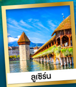
ลูซิิร์น