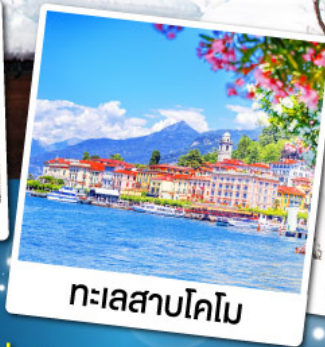
ทะเลสาบโคโม