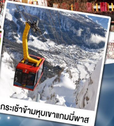
กระเช้าข้ามหุบเขาแกมมีฟาส